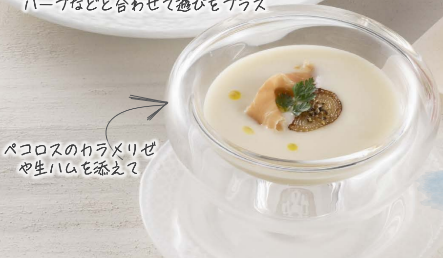
冷製ポタージュ ヴィシソワーズ