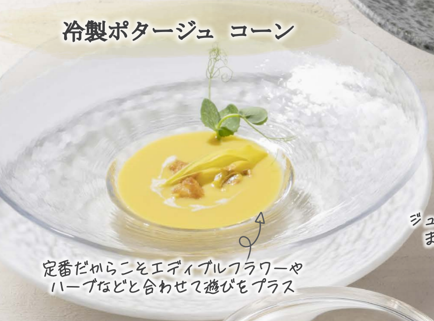
冷製ポタージュ コーン